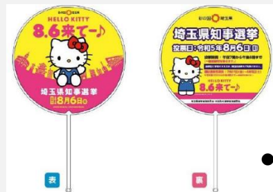
●うちわなどのプロモーションツール